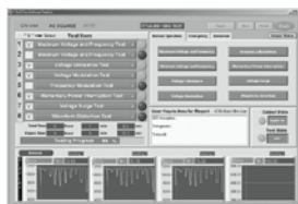
航空電源測試: RTCA DO-160D測試