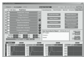
航空電源測試: MIL-STD-704F測試