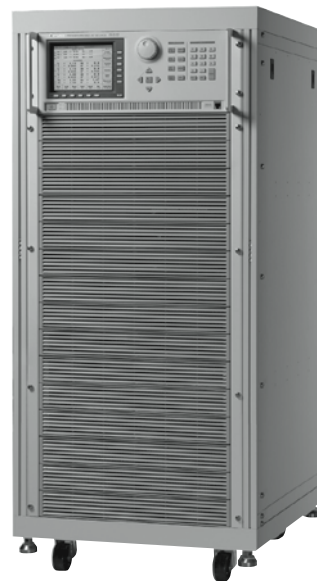
Model 61511, 61512